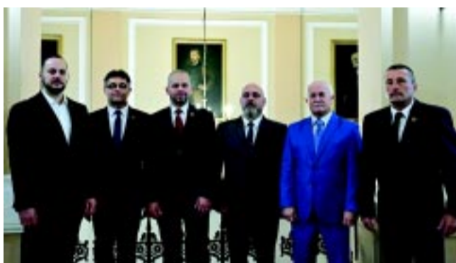
A Szövetségben Nyíregyházáért frakció

Ezeket túl az idősök ellátása, a szociális feladatok is a prioritások között szerepelnek, mivel több ezer szépkorú él a városban és ez a szám intenzíven nő. A kötelező feladatok mellett több önként vállalt programot is indított és finanszíroz a város. A TOP Plusz forrás nagymértékben segíti a tervek megvalósítását, Nyíregyháza kapta a legtöbb forrást a megyei jogú városok között, több mint 52 milliárd forint összegben. Ehhez teszi hozzá a város a saját forrásait is, ennek is köszönhető, hogy a város fejlődése teljesen pozitív irányt vett. A polgármester hozzátette, nem a kirakat, a külsőség számít, hanem az, hogy minden nyíregyházi számára elérhetővé váljanak a különböző szolgáltatások.